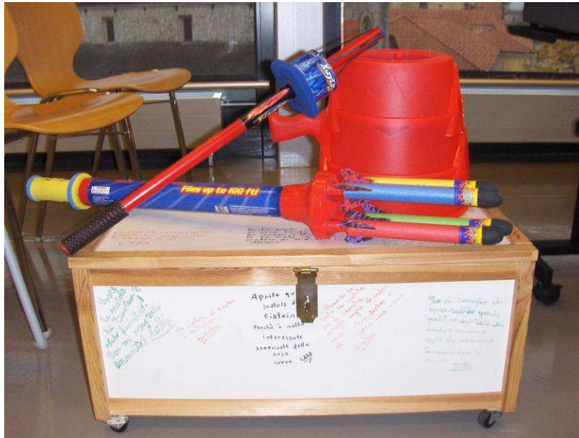
La scatola di Einstein